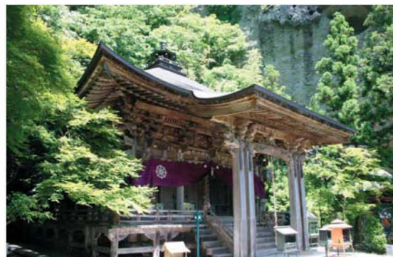
珍しい装飾をあしらった 大師堂。設計は、愛媛県出身の 河口庄一氏