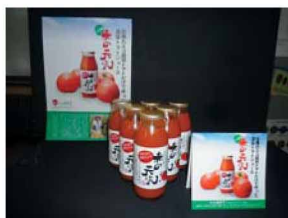
化学調味料は一切使用しない無添加で安全なジュース。

久万高原町は、愛媛県のほぼ中央部に位置し、標高1000mを超える四国山地に囲まれた山間地域である。町の総面積の9割を森林が占め、良質な地元産材を利用した「木にこだわりのまちづくり」の推進や、四季折々の美しい自然と渓谷美を中心とした観光振興、冷涼な気候と清流の恵みを受けて育てた高原野菜の生産に力を入れて取り組んでいる。