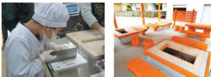
そばづくり体験の様子