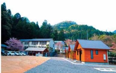
和室6畳一間・浴室・トイレなどを備えた3棟のバンガロー

ゆ〜っくり、の〜んびり、お手軽「いななか体験」 虫でも有名な増川地区の木造校舎を改築した施設で、そばづくりや稲刈りなどの農林業体験が楽しめる。