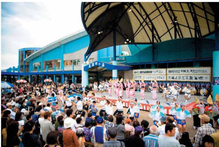
吉野川ハイウェイオアシス:地元阿波踊り連6連の合同による阿波踊り無料公演の様子

島の総合レジャー施設として年間100万人を超す人々が利用する。中でも年間を通じて開催される、徳島の郷土芸能「阿波踊り」の無料定期公演は人気で、目の前で繰り広げられる乱舞は訪れる人々を魅了している。